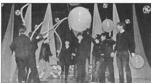
Репетиция команды КВН.