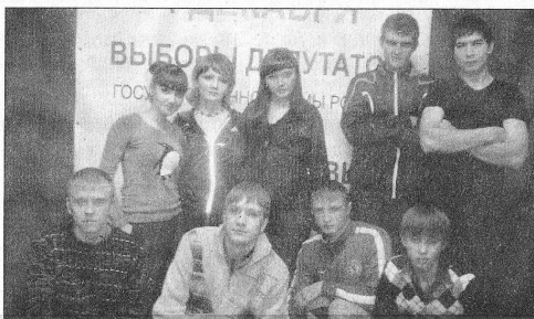
Участники городского молодежного лагеря.